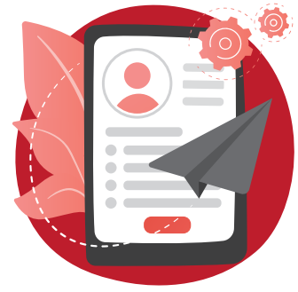
3. Schritt Ausschreibung veröffentlichen