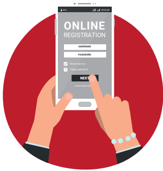
1. Schritt Registrierung