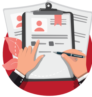
2. Schritt Job Ausschreibung