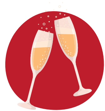
6. Schritt Viel Erfolg bei Ihrem Event!