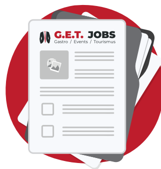
5. Schritt Übermittlung der Jobdetails