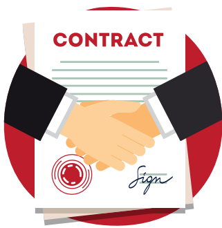
4. Schritt Personal antwortet Zusage/Absage